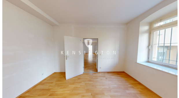
Zimmer zum Hinterhof